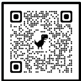
《最珍贵的礼物》 绘本

幼儿观看了有声绘本并在老师的引导及解说下，学习了“礼轻情意重”的意思。之后，幼儿用心制作了卡片，并将这份珍贵的礼物送给自己的家人、朋友或老师。